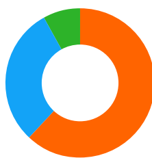
Przychody wg regionu